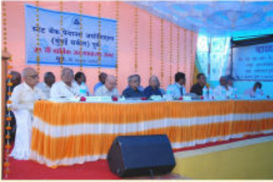
Annual General Meeting Dt. 27 th August 2013 Circle Managing Committee on the Dais

Regd. under RNI No. MAHBIL/2008/25425 & Declaration No. PHM/SR/63/VIII/2008 Dated 12/5/2008 SSPO Pune under Postal Concession register No. PNCW/M-144/2011-2013 Dated 10.12.2010 Permission to Post without Prepayment No.: WPP-217 at Market Yard P.S.O. on 25th of each Month and Published on 25 th of the Month